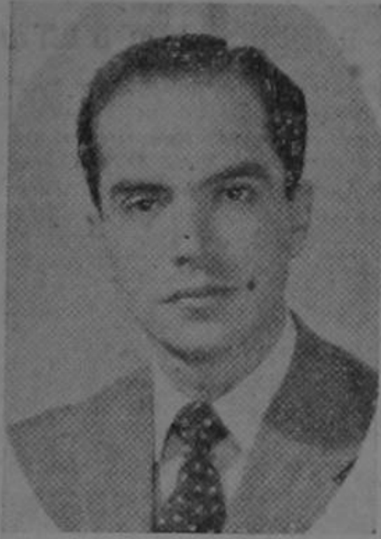
Nuestro homenaje de hoy para el licenciado don Rodrigo Facio Brenes.

Con noble espíritu, de lucha, impulsado por la fuerza vigorosa de su juventud plena, el licenciado Rodrigo Facio Brenes constituye una figura de relieves brillantes dentro del conglomerado de valores nuevos de la república. Vastos los conocimientos que no debe a la experiencia sino a sus claros talentos y a su infatigable devoción por el estudio, el licenciado Facio Brenes es uno de nuestros más destacados valores en el campo de las ciencias económicas y del derecho, donde ha definido, con proyecciones luminosas, la potencialidad de su capacidad creadora y su amplio sentido de iniciativa propia. Dirigente de uno de los partidos políticos que en la actualidad cuenta con fuerza arrolladora en toda la república, su voz la escuchan atentamente los de la gran masa popular, para conocer a fondo los graves problemas que pesan trágicamente sobre la patria y como ha de ser la forma de resolverlos.